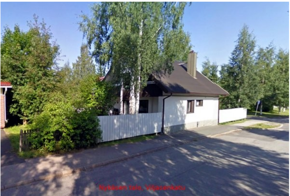
Nykäsen talo, Viljasenkatu

Eroni jälkeen asuin joitakin aikoja Kenttädulla talossa, jossa muuan vanha leidi piti vuokrakasarmia. Se oli vuokrannut jokaisen tarjolla olevan komeron, ja eräskin homo kokki asui siellä vaatehuoneessa. Tämä kyseinen nainen oli yhteiskunnallisesti aktiivinen, ja keräsi rahaa Matti Nykäsen taloa varten. Täytyihän sitä toki Matille saada oma talo! Hän ei suinkaan toiminut tässä täysin yksin, vaan mukana oli melkoinen joukko muitakin ihmisiä. Talo, jossa itse asuin, saattoi olla juuri ylläolevassa kuvassa näkyvä rakennus, mutta saattaa olla, että se oli joku viereinen pytinki - vaikkakaan ei ole varma mistään näin jälkikäteen. Joka tapauksessa sen yläkerroksen ikkunasta avautui suora näkymä Nykäsen talolle. Eli: olin taas kerran, ja täysin satunnaisesti, joutunut Nykäsen naapuriin. Tämä ei juurikaan viettänyt aikaansa talossa, koska hyppyyra oli vielä tuolloin hyvässä vauhdissa. Itse asiassa en nähnyt talolla koskaan ketään.