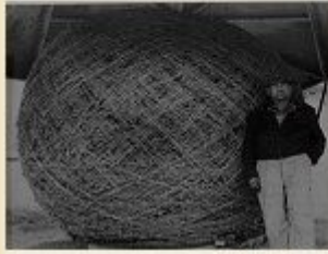
Naruvallu ja atomipommimies